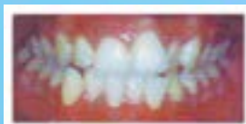
ANTES de invisalign