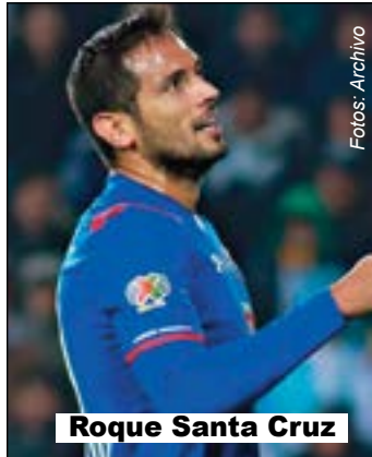
Roque Santa Cruz