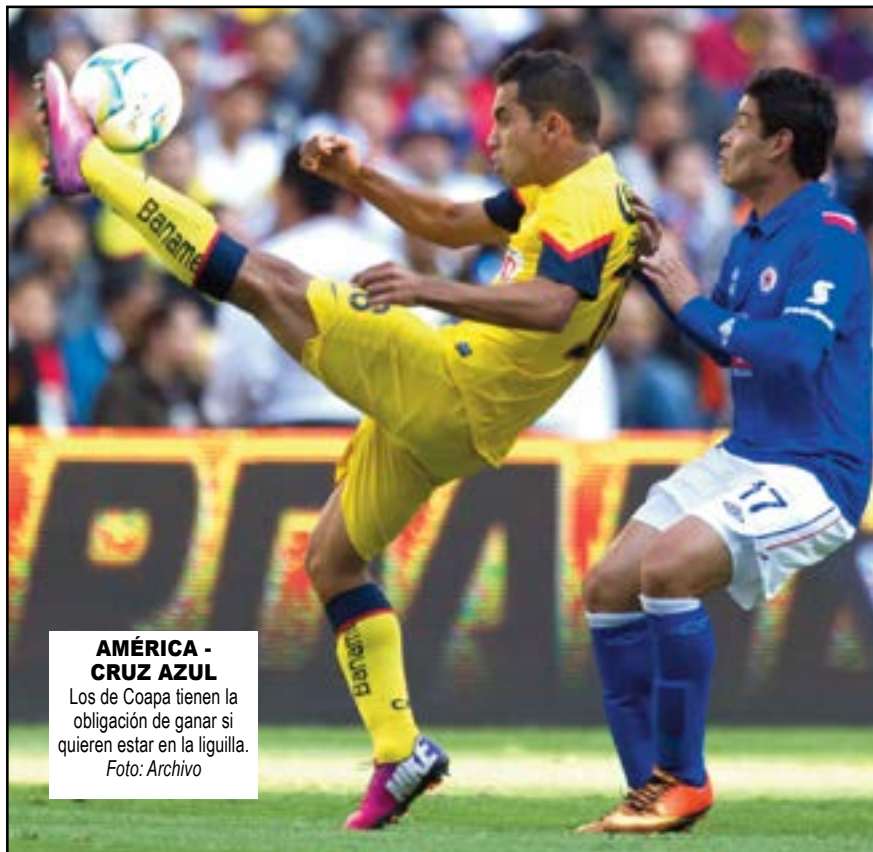
AMÉRICA - CRUZ AZUL Los de Coapa tienen la obligación de ganar si quieren estar en la liguilla.

unfo para meterse en zona de clasificación. También habrá otro clásico, se trata del Derby Tapatío en donde Atlas recibe en el Estadio Jalisco a las Chivas. Por el lado de los Rojinegros están concentrados para quedarse con los tres puntos y no perder el paso en su camino a la clasificación, mientras que en la cera del frente, los del Rebaño aún se encuentran complicados en el tema del descenso, por lo que deben seguir consiguiendo puntos, sin embargo hay un estadística que