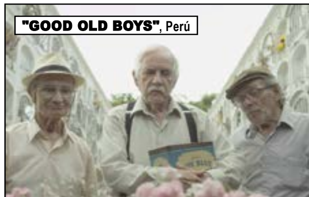
"GOOD OLD BOYS", Perú