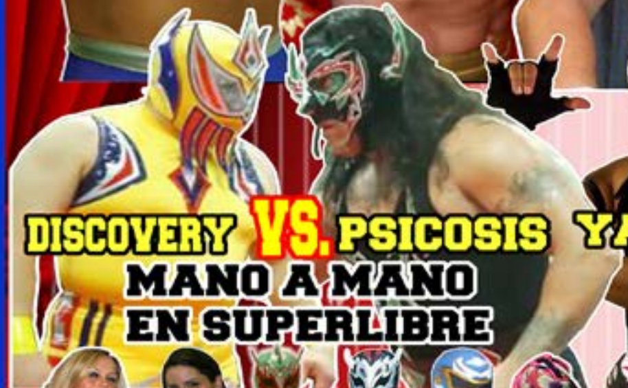
DISCOVERY VS. PSICOSIS MANO A MANO EN SUPERLIBRE