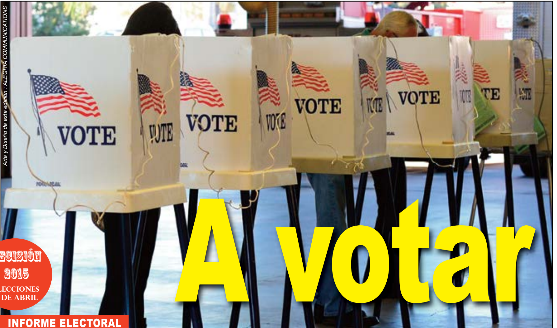
Arte y Diseño de esta edición : ALEGRIA COMMUNICATIONS