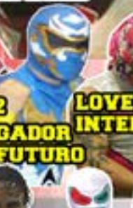
VENGADOR DEL FUTURO