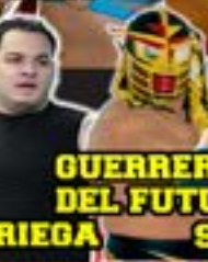
GUERRERITO DEL FUTURO