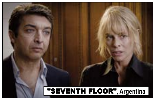
"SEVENTH FLOOR", Argentina