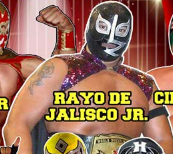
RAYO DE JALISCO JR.