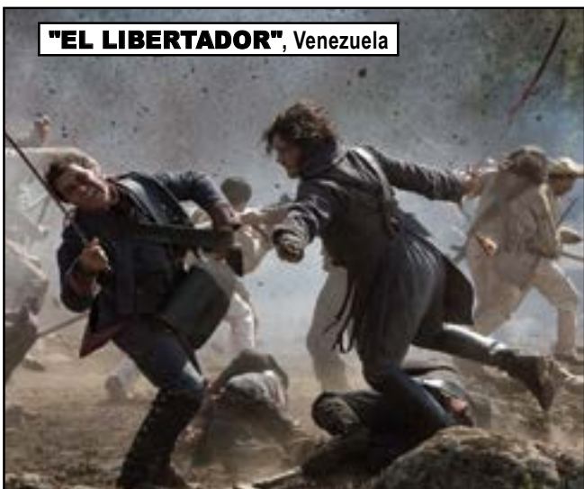
"EL LIBERTADOR", Venezuela

Del 9 al 23 de abril 9 a 23, en el cine AMC River East 21, te esperan más de 120 películas de América Latina, España, Portugal y los Estados Unidos.