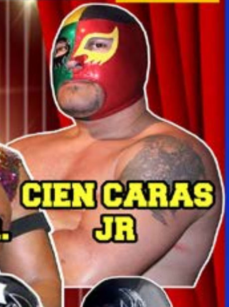
CIEN CARAS JR