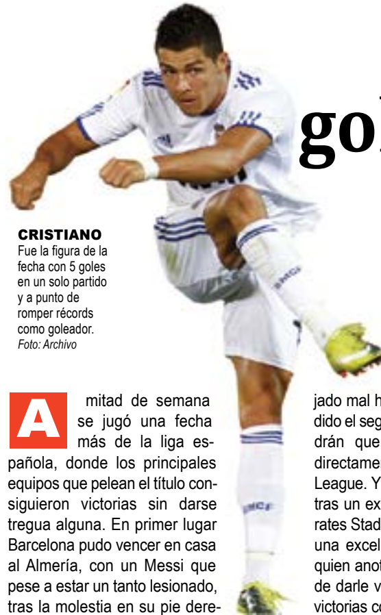
CRISTIANO Fue la figura de la fecha con 5 goles en un solo partido y a punto de romper récords como goleador.

Real Madrid le metió 9-1 al Granada y Barcelona 4-0 al Almería... pero todo sigue igual en La Liga.