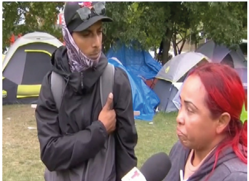
incidentes separados bajo sospecha de amenazar o golpear a agentes en una comisaría.

A principios de esta semana, varios inmigrantes fueron arrestados en