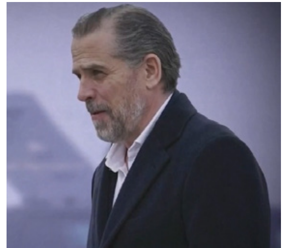
El caso está siendo supervisado por el fiscal especial David Weiss, quien también dirigió la investigación.