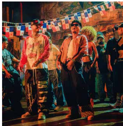
capítulo de su música.

A rancando el nuevo año con su estilo característico, Farruko lanza su nuevo sencillo, "Ay Dale", junto al artista panameño Eddy Lover. La canción y su video musical oficial están disponibles en todas las plataformas a partir de hoy.