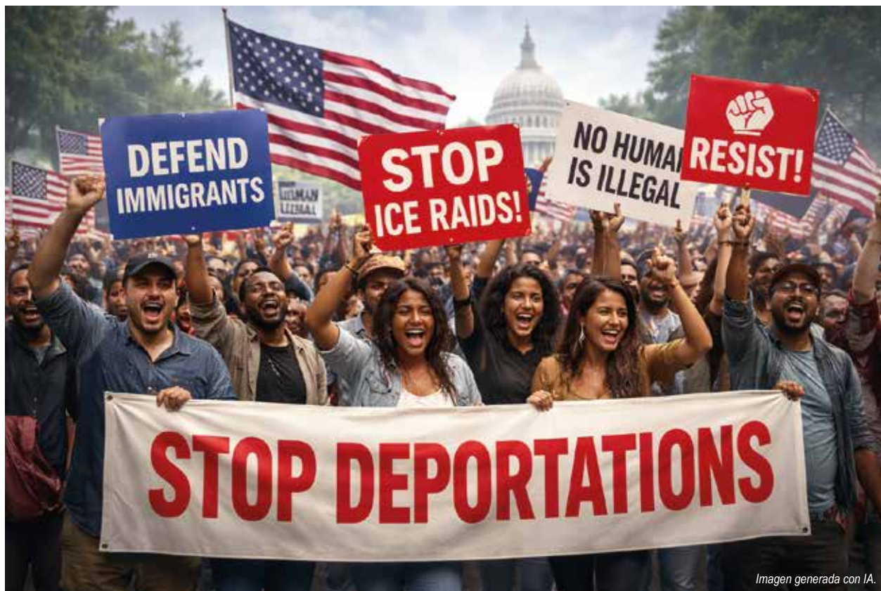
Imagen generada con IA.

El alcalde de Chicago, Brandon Johnson, llamó a una protesta nacional sostenida, inspirada en el Movimiento por los Derechos Civiles, para enfrentar lo que considera abusos de agentes de ICE y las políticas del gobierno federal sobre inmigración. Johnson adelantó que evalúa nuevas medidas, incluso enjuiciamiento, para hacer responsables a quienes violen derechos civiles.