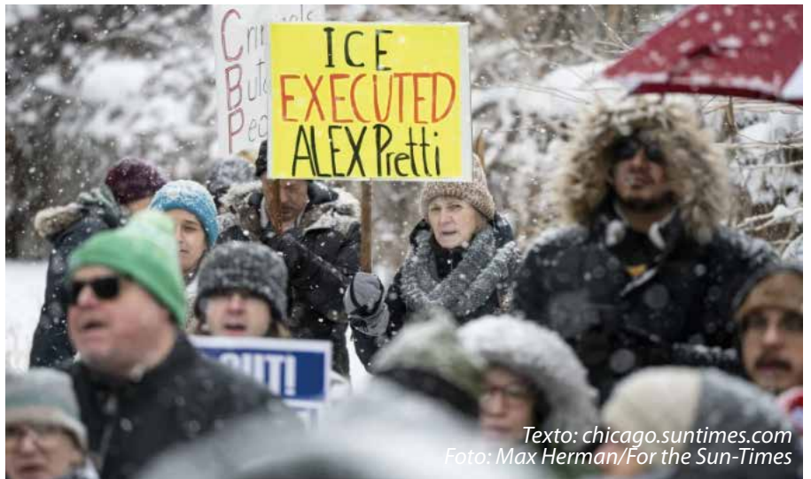
Texto: chicago.suntimes.com

Para ayudar a garantizar ese mismo nivel de rendición de cuentas en Chicago, el alcalde dijo que respalda una ordenanza aprobada por un comité conjunto el martes que facultaría a la Oficina Civil de Respon-